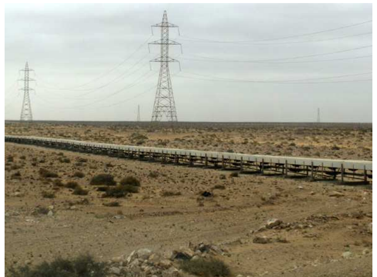
Cinta transportadora de fosfatos a las afueras del Aaiún, camino a Boiador.