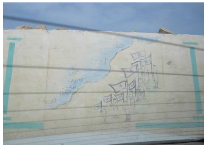
Colegios del Aaiún y Bojador con representaciones de la Marcha Verde