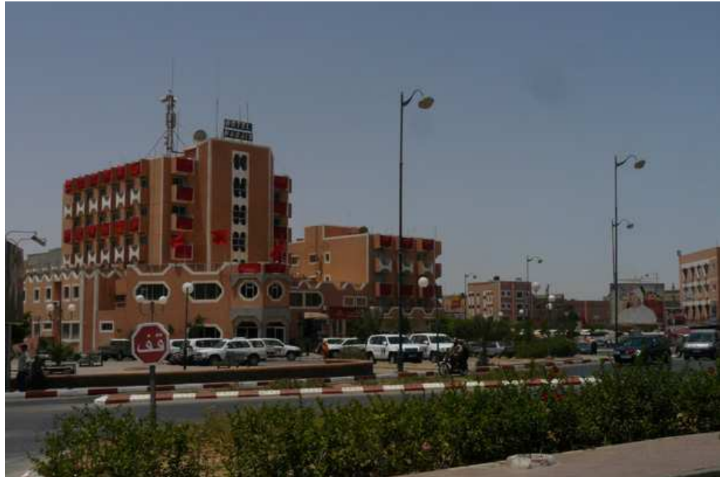
Hotel Nagjir, donde se aloja la MINURSO