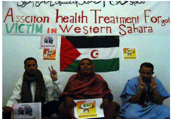
Asoc. Asistencia Médica a las Víctimas Olvidadas S.O.