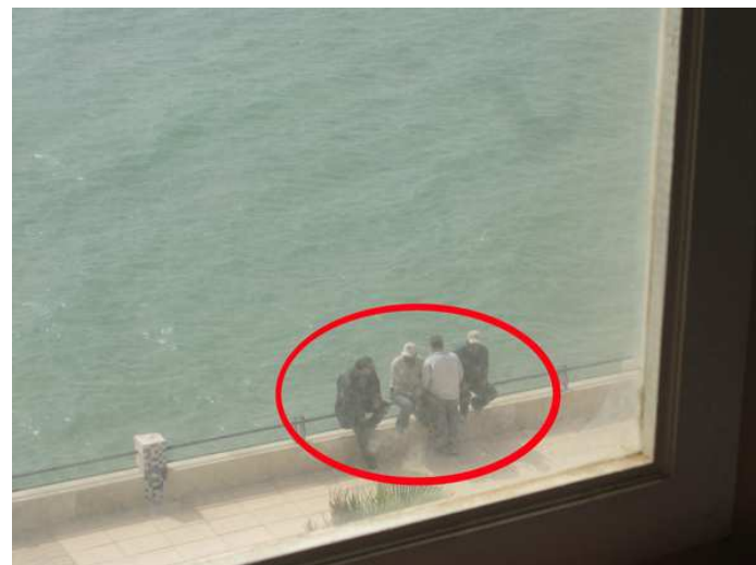
Más momentos del seguimiento en Dajla