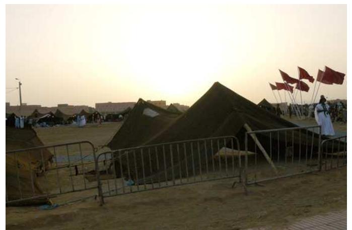
Fiesta de Guelmin donde se muestra la apropiación marroquí de la cultura saharai