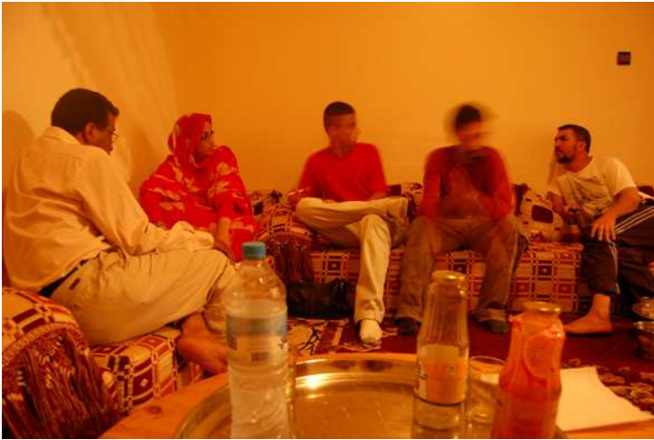
CODESA - Aaiún