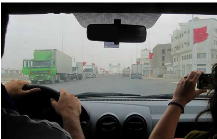
Avda. Puerto del Aaiún con camiones blancos que exportan la pesca expoliada