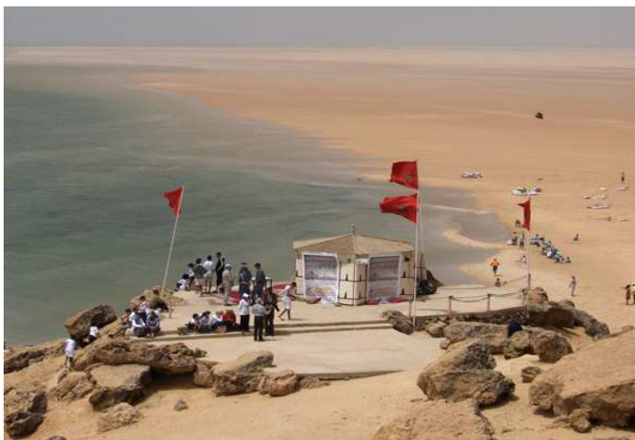
Playa de Dajila