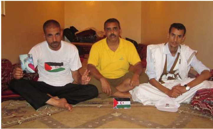
CSPRON v AFAPREDESA