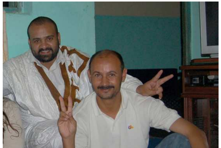
CODESA - Tantan