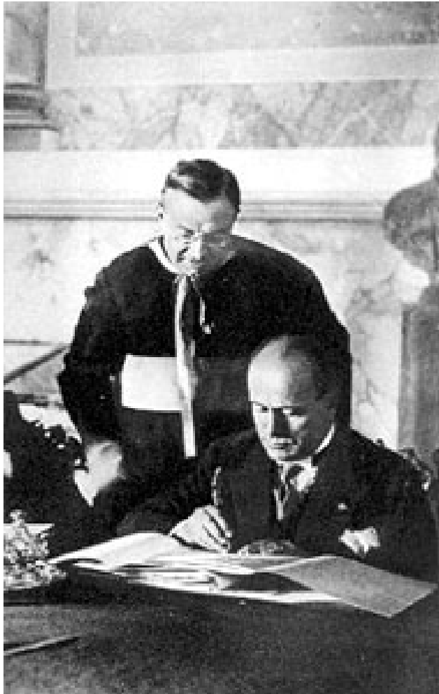
Italia, 1929. El cardenal Gasparri y Mussolini firman los Pactos de Letrán.