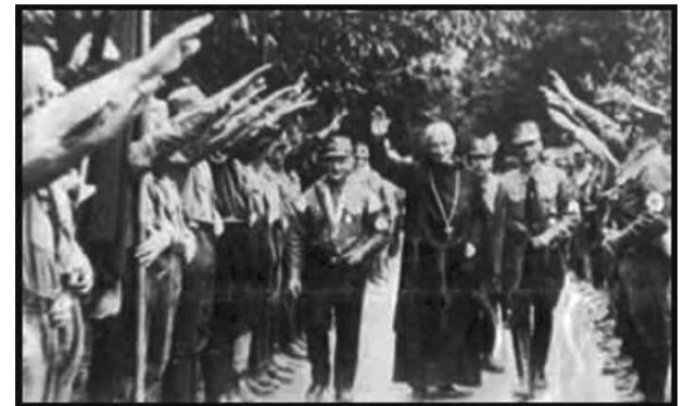
La Iglesia Nazi.