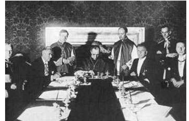
El Cardenal Pacelli (más tarde Pío XII) firma con Alemania el Concordato de 1933.