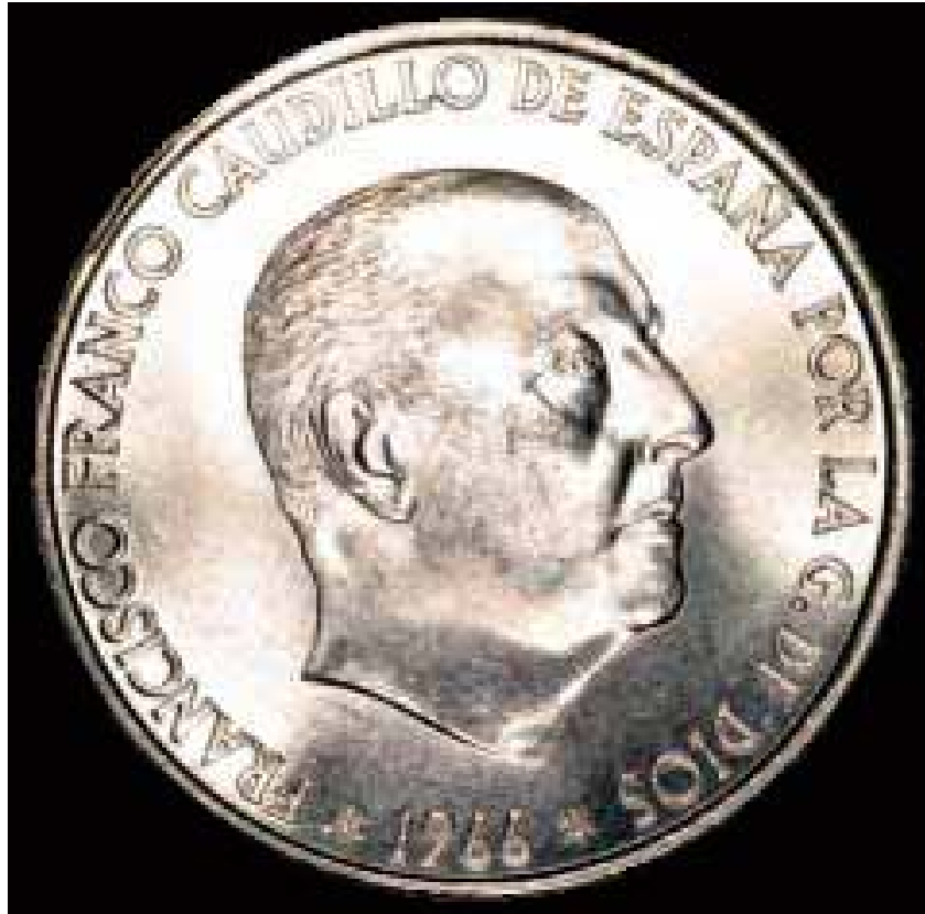
Caudillo de España...