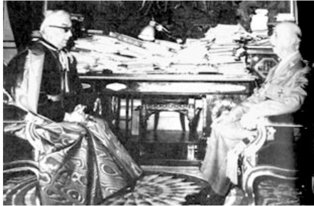
Cardenal Vicente Enrique Tarancón en audiencia con Franco, 26 de mayo de 1969.