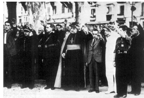
Obispo de Málaga, tras la ocupación franquista de la ciudad.